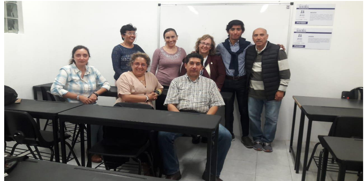
Sesión Ordinaria Presencial del Consejo de Participación Ciudadana de Educación.