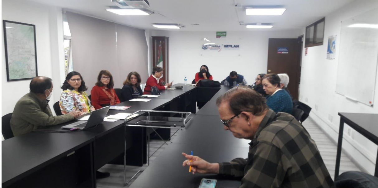
Sesión Ordinaria Presencial del Consejo de Participación Ciudadana del Centro Histórico y Patrimonio Edificado.