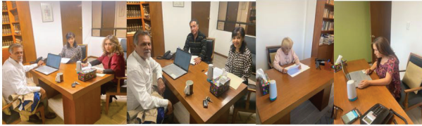
Fotografía dos: Reunión con consejeros para diseño de informe anual de trabajo del Consejo Ciudadano de Desempeño Gubernamental.