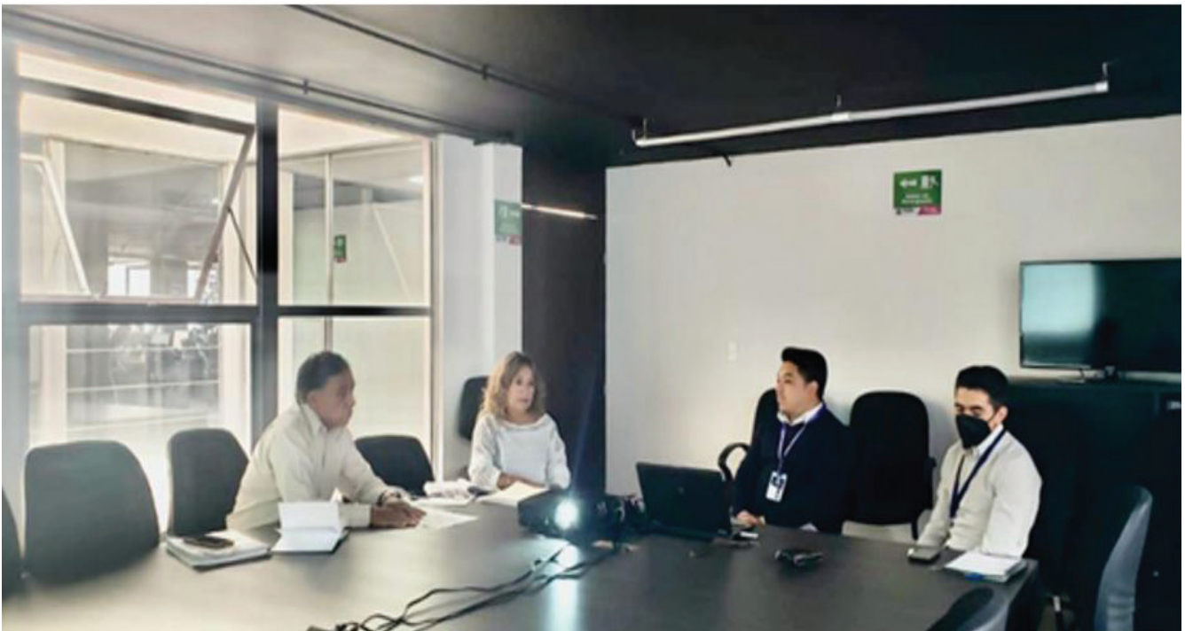
Fotografía uno: Mesa de trabajo con personal de Contraloría Municipal