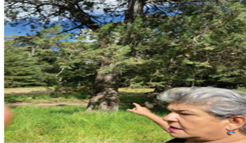
Fotografía tres: Monitoreo in situ de Proyecto: “Parque el Ajolote, Bosques de Xonacatepec”.