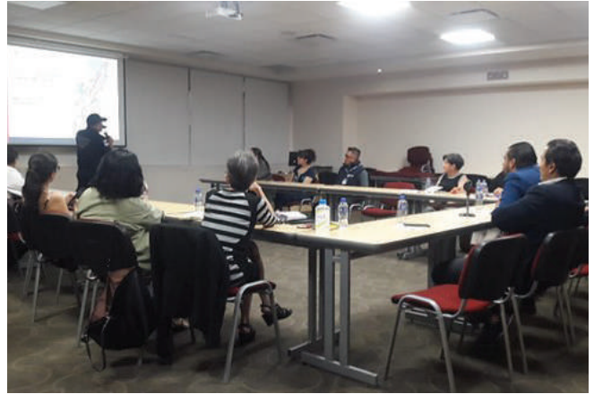
Mesa de trabajo en materia de seguridad y prevención del delito, app Alerta Contigo.