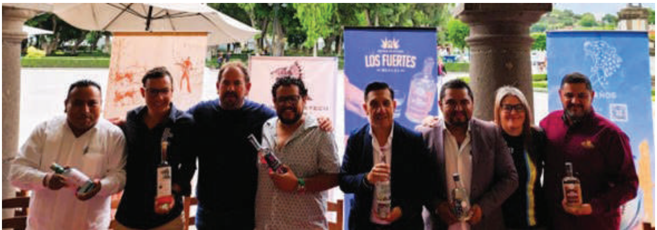
Difusión de la Marca Puebla es mi Mezcal.