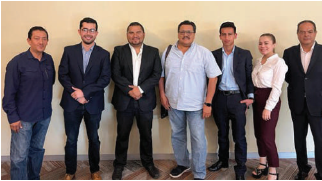
Seminario de Calidad y Competitividad en el Servicio al Cliente Interno.