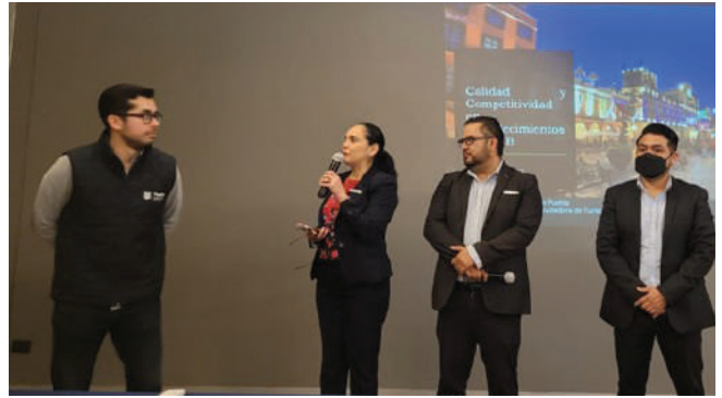
Curso Taller, Calidad y Competitividad en Establecimientos de Alimentos y Bebidas.