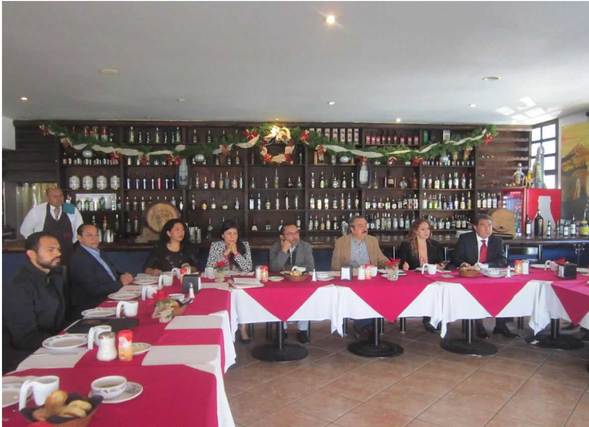
C.P.C DE DESARROLLO URBANO