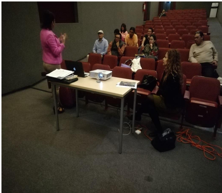
C.P.C DE CULTURA