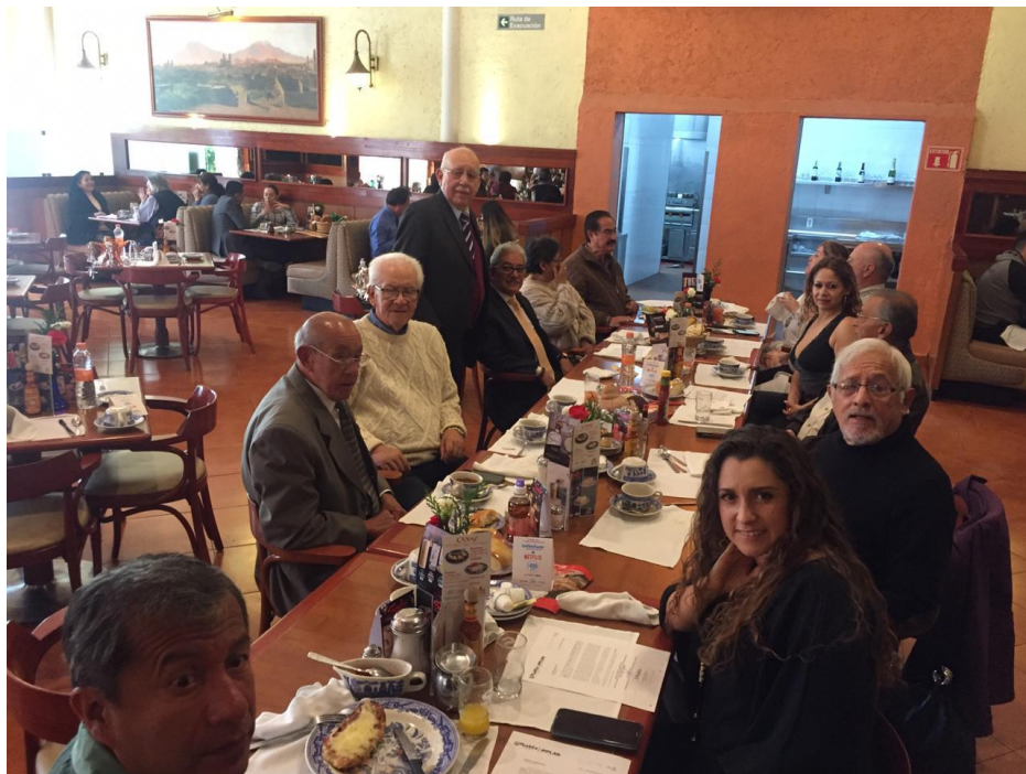
C.P.C DE OBRAS Y SERVICIOS PÚBLICOS