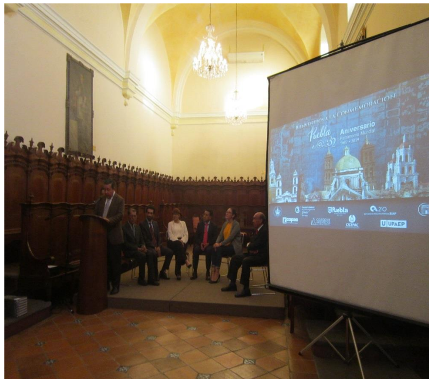
C.P.C DE CENTRO HISTÓRICO Y PATRIMONIO EDIFICADO