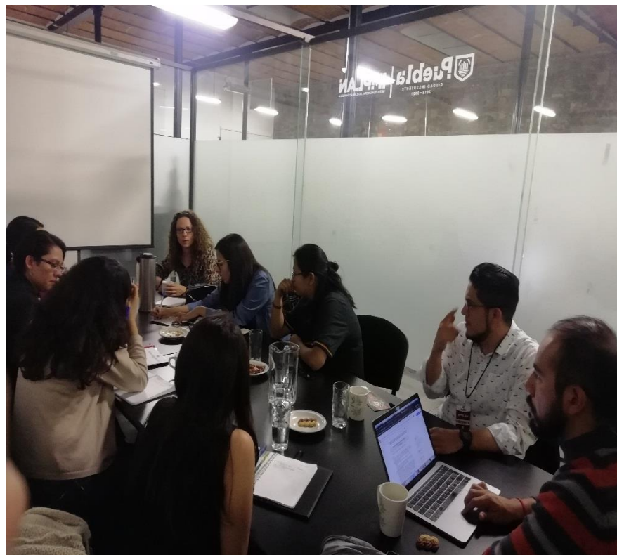
C.P.C DE DERECHOS HUMANOS E IGUALDAD ENTRE GÉNEROS