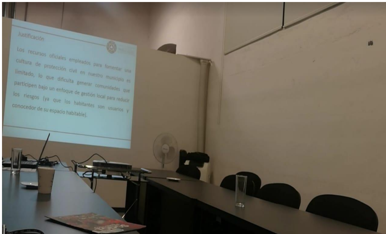
C.P.C DE PROTECCIÓN CIVIL