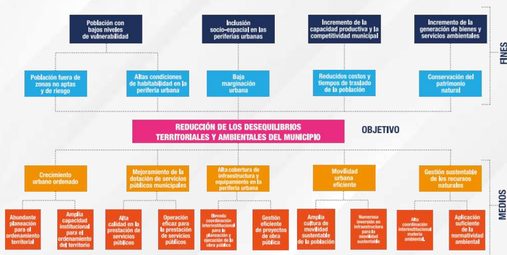
Figura 3. Árbol de objetivos del Eje 4. Urbanismo y Medio Ambiente del PMD

Siguiendo esta lógica, la situación negativa del árbol de problemas se transforma en una situación positiva en el árbol de objetivos, tal como se indica en la siguiente figura: