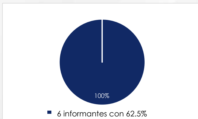
Gráfica 2: Grado de conocimiento de la normatividad que regula el FAISMUN-DF

Como se observa, el grado de conocimiento de los responsables se ubica en 62.5 por ciento, en apego al número de preguntas contestadas. En la siguiente gráfica se visualiza el porcentaje de informantes que se ubicaron las valoraciones antes mencionadas, donde el 100 por ciento de los informantes tuvo un 62.5 por ciento del conocimiento.