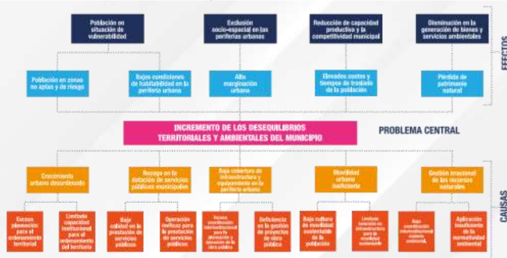
Figura 2. Árbol de problemas del Eje 4. Urbanismo y Medio Ambiente del PMD 2021-2024

En la siguiente figura, se observa el árbol de problemas del Eje 4. Urbanismo y Medio Ambiente, en el cual se identifica la problemática que atiende el fondo, el cual se describe expresamente como: “Incremento de los desequilibrios territoriales y ambientales del municipio” .